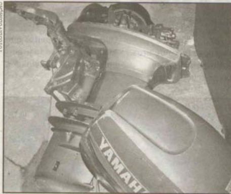
O motor recuperado foi levado de marina e reconhecido pelo dono