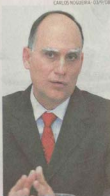
Papa: desafio é a Zona Noroeste

O prefeito de Santos, João Paulo Tavares Papa (PMDB), comemorou o melhor índice de aprovação entre os governantes da Baixada Santista: 82,6%. "Acho muito bom a gente poder contar com a confiança da população. Governar não é tarefa fácil, mas é sempre melhor tomar decisões importantes podendo contar com o apoio da maioria da população", salientou Papa.