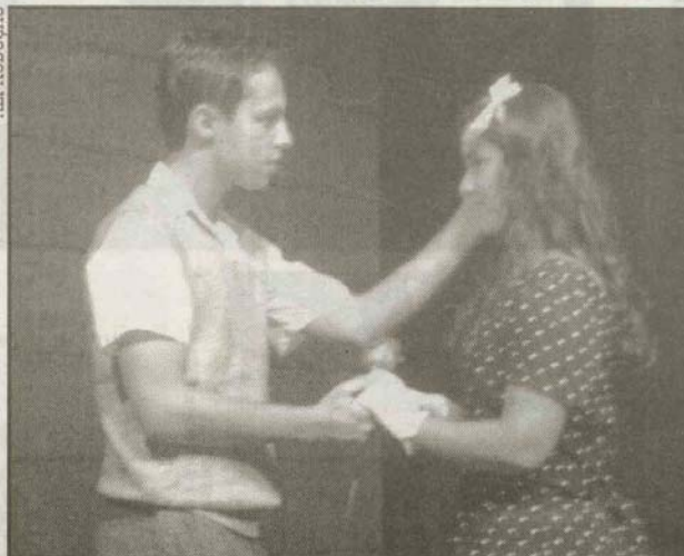
Cia. Quem Sabe Faz a Hora agita o Teatro Procópio Ferreira